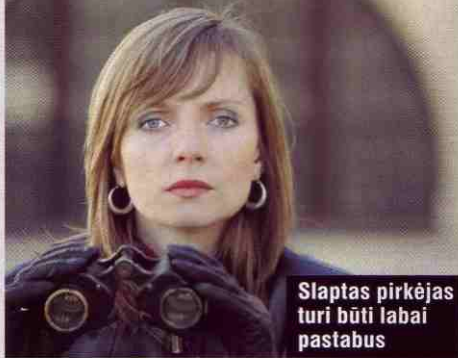
Slaptas pirkėjas turi būti labai pastabus