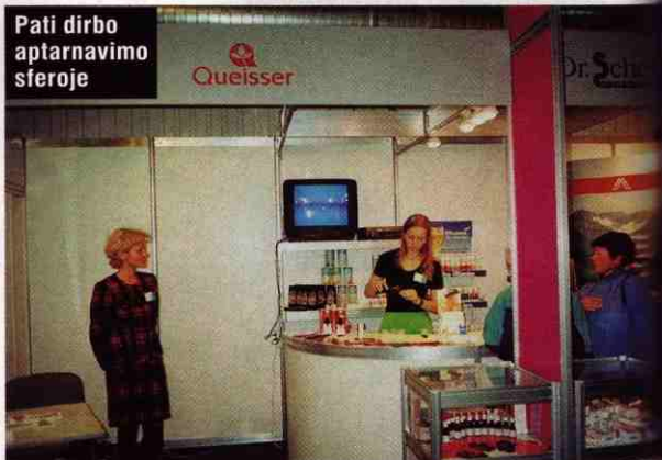
Pati dirbo aptarnavimo sferoje

Kai slapta pirkdavau, ne kartą užtikau pardavėjus, užkandžiaujančius darbo vietoje. Kartą labai užkliuvo vienas konsultantas – jis buvo užsiauginęs ilgą mažojo pirštelio nagą. Dažnai pasitaiko, kad pardavėjai kalbasi mobiliu telefonu ir į užsukusį klientą nekreipia dėmesio. Negražiai atrodo, jei kas iš personalo rūko gat-